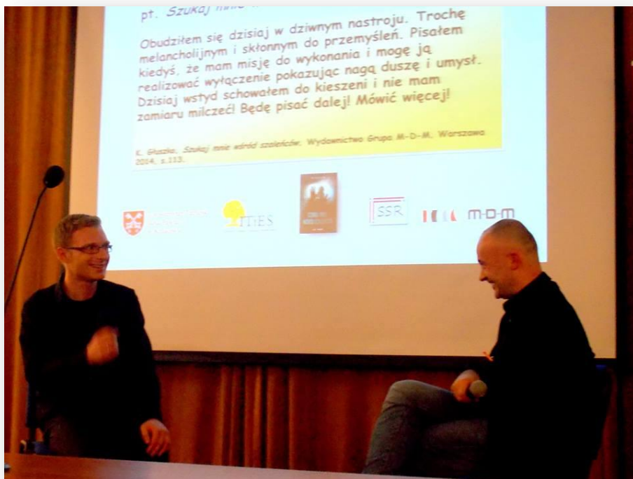
Obudziłem się dzisiaj w dobrym nastroju