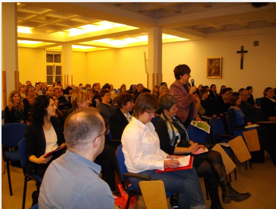
Refleksję wzbogaciły wystąpienia uczestników Seminarium