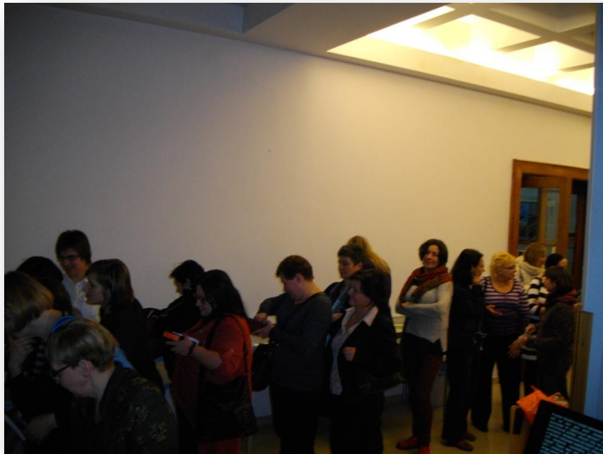
W oczekiwaniu na spotkanie z Autorem